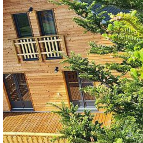
Grand Chalet Balnéo Zen Altitud - Chastreix